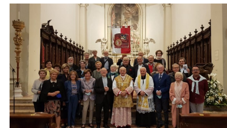
Foto ricordo dopo la Santa Messa nel Duomo di Pordenone.